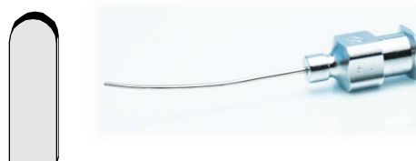
HS-9919 宮崎式テノン嚢下麻酔針 22G 平型