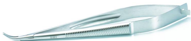
HS-9916 名古屋大学式持針器