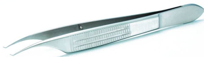
HS-9917 柿崎式眼瞼用鑷子