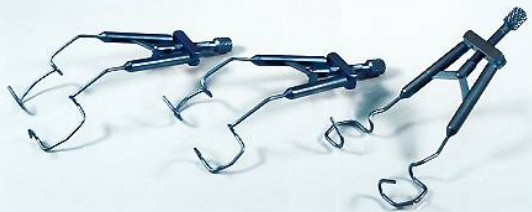
HS-9833 A/B/C チタニウム開瞼器 A:R-02 大14mm B:R-03 小10mm C:R-01 テンポラル10mm チタニウム製V字ネジ式開瞼器が発売されました。