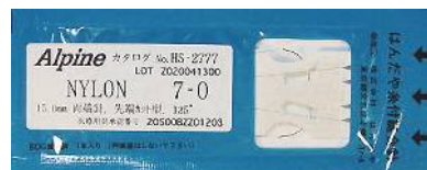
(クロコダイルクランプとアルパイン糸付針)